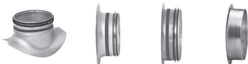
PSUSS | ILRUSS | ILUSS | ILFSS