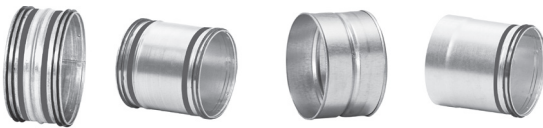
NPUSS | SNPUSS | MFSS | SMFUSS