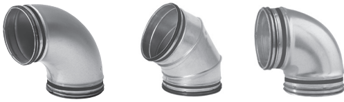
BUSS | BFUSS | BKUSS | BKFUSS | BKMUSS | BSUSS | BSFUSS