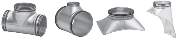
TCPUSS | TCPUSS KORT | TCUSS | TUSS | TCPMUSS | TSTCUSS | TSTUSS